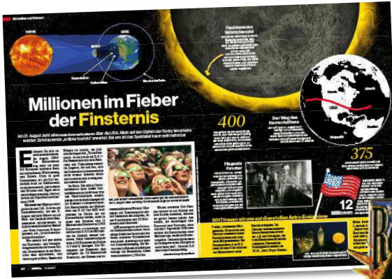
In Heft 34 berichtete SUPERillu über die totale Sonnenfinsternis vom 21. August. Der Kernschatten zog 4023 km quer über die USA

Hier erzählen SUPERillu-Leser von ihren Urlaubserlebnissen . Schreiben auch Sie uns – egal, wo Sie waren und ob Sie ein echtes Abenteuer erlebt haben, eine kuriose Begebenheit oder sich einfach gern erinnern