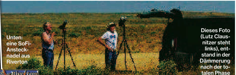
Unten: eine SoFi-Anstecknadel aus Riverton